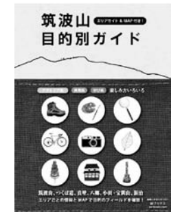
「筑波山目的別ガイド」

○ お申し込みいただきましたら、本と一緒に振替用紙を同封させていただきます。 到着後、郵便局よりお振り込みをお願いいたします。