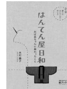
「はんでん屋日和 -おばあちゃんに教わったこと」 B5判、112ページ